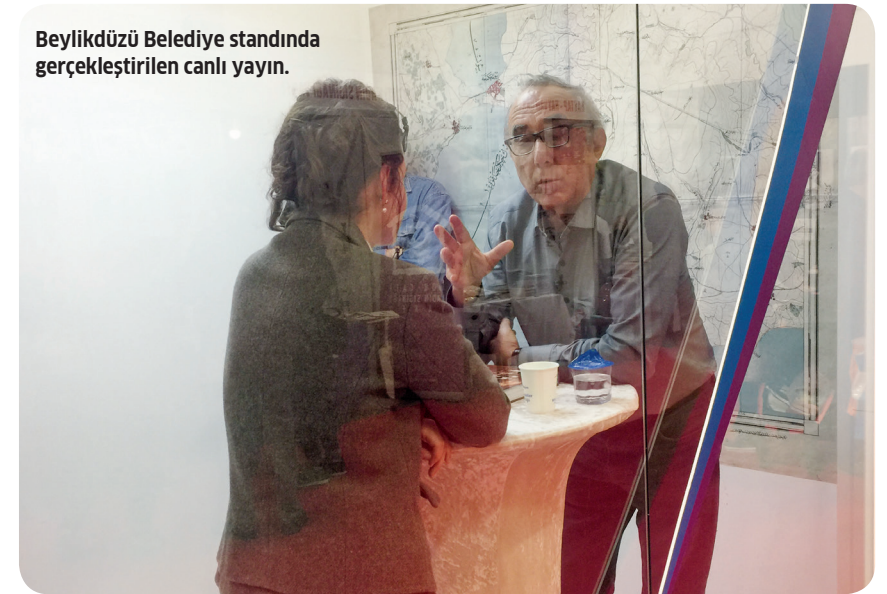
Beylikdüzü Belediye standında gerçekleştirilen canlı yayın.