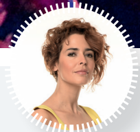
PELİN BATU OYUNCU - ŞAIR - TARİHÇİ BEYLİKDÜZÜ MON AMOUR SEVDAM BEYLİKDÜZÜ SAYFA 12