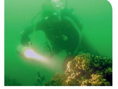
BEYLİKDÜZÜ DENİZE AÇILDI KIYILARINDA TARİH YATIRIYOR SAYFA 16-17

facebook / beylirkduzubelediyesi twitter / beylirkduzubeltr