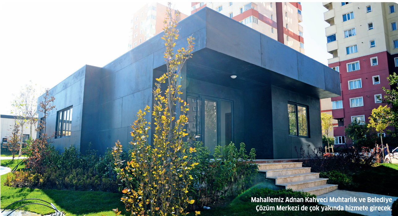
Mahallelerimiz Adnan Kahveci Muhtarlık ve Belediye Çözüm Merkezi de çok yakında hizmete girecek.

“Muhtarlık ve çözüm merkezinin birlikte çalışmasının en önemli faydası, mahallerimizdeki problemlerin daha hızlı çözülmesini sağlamış olmasıdır. Ayrıca belediyeye ilgili talep ve şikâyetlerin, belediye ana binasına gidilmeden, oluşturulan bu çözüm merkezlerinde rahatlıkla yapılabilmesi sağlanıyor.