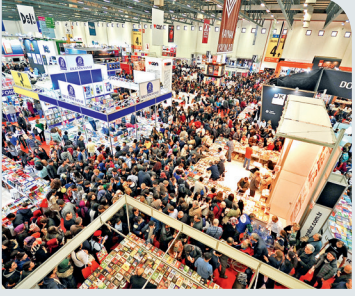
KİTAPSEVER BEYLİKDÜZÜ, TÜYAP KİTAP FUARI'NDA SAYFA 4-5