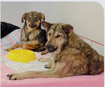
ÖRNEK BİR TESİS: "BEYLİKDÜZÜ BELEDİYESİ GEÇİCİ HAYVAN BAKIM EVİ" SAYFA 18-19