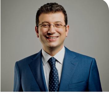
SİZİN İÇİN... EKREM İMAMOĞLU Beylikdüzü Belediye Başkanı SAYFA 3