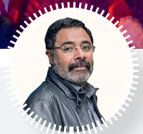
AHMET ÜMİT YAZAR "BEYLİKDÜZÜ ETKİNLİKLERİNİ ULUSLARARASI ALANA TAŞIMALI" SAYFA 6