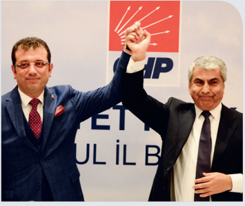
EKREM İMAMOĞLU'NA ONURLU GÖREV İBB SEÇİM SERÜVENİ SAYFA 2