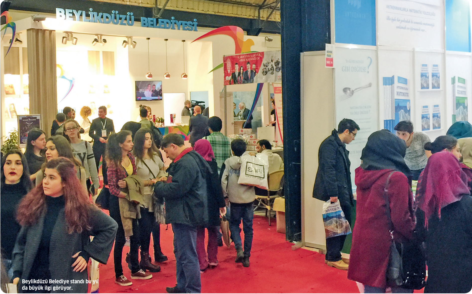
Beylikdüzü Belediye standı bu yıl da büyük ilgi görüyor.